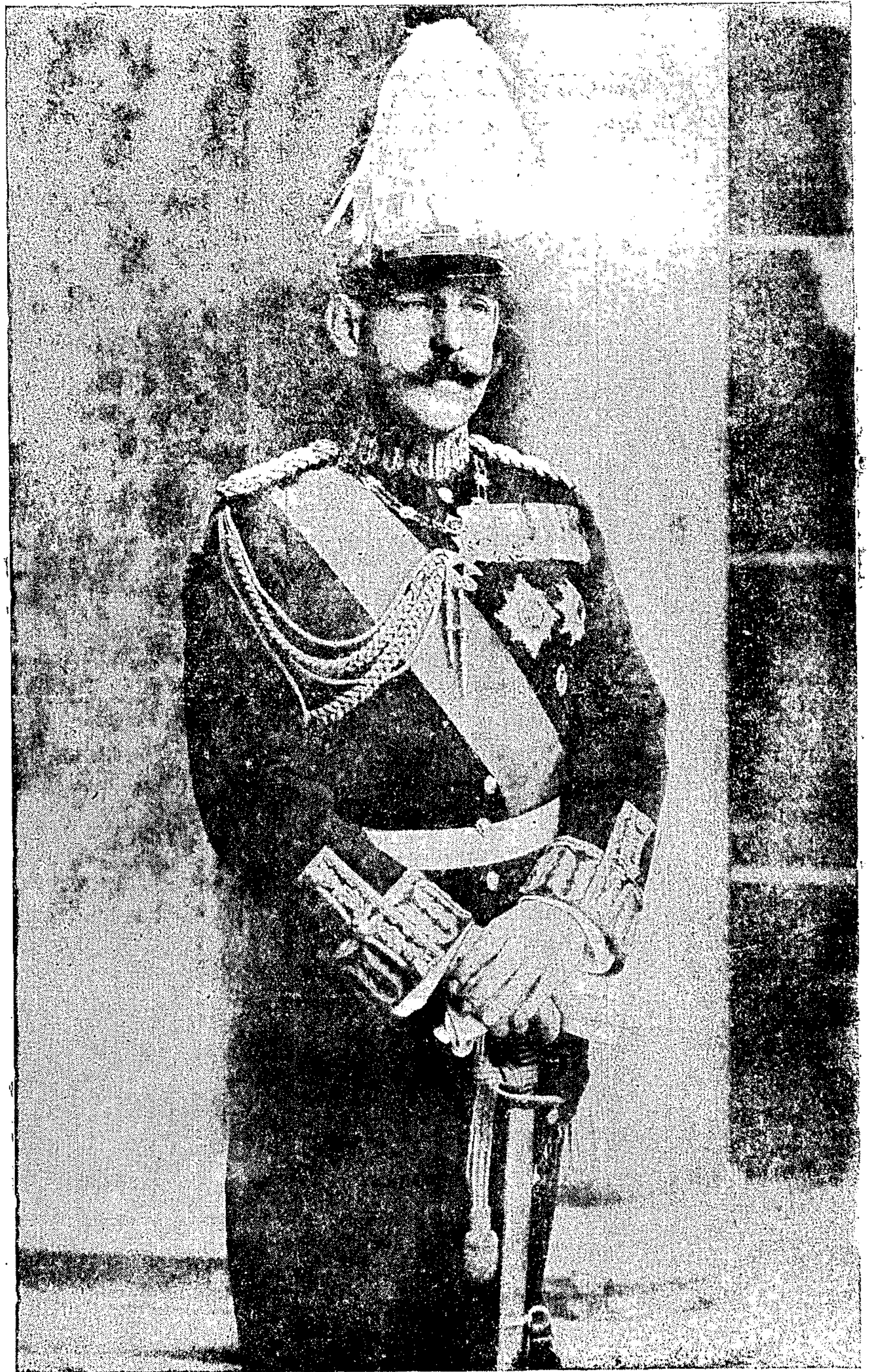
Ὁ Ἀρχιστράτηγος τοῦ Ἑλλ. στρατοῦ καὶ Διάδοχος τοῦ Ἑλλ. θρόνου, ὅστις χθὲς εἰσήλθε μετὰ τῶν στρατευμάτων του εἰς τὴν Θεσσαλονικίαν.